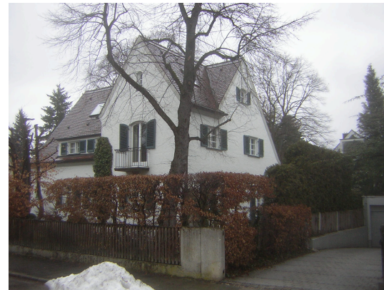
Bestand, Ansicht von Südwesten