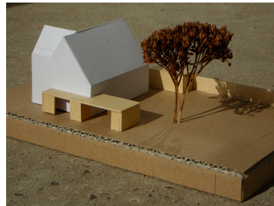
Modellfoto Var. 3, von Südosten